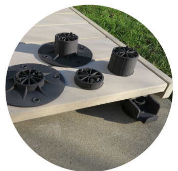
Einfache Anpassung der Höhe