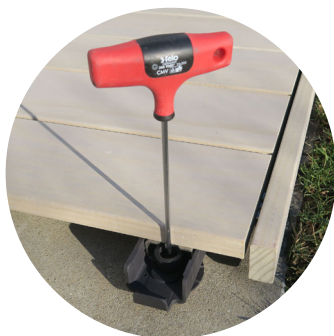
Modular und wartungs- freundlich